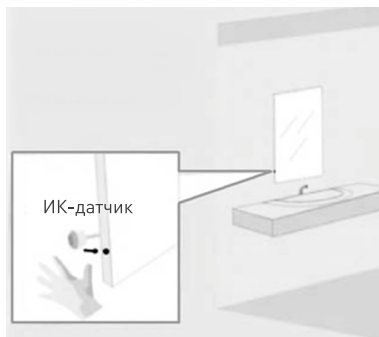
Вариант установки SR-Hand-Switch-Silver-R SR-Hand-Switch-Silver-S SR-Hand-DIM Silver-R SR-Hand-DIM Silver-S

3.3. Подключите светодиодную ленту или другой светодиодный источник света к выходным проводам LED- и LED+ диммера, соблюдая полярность.